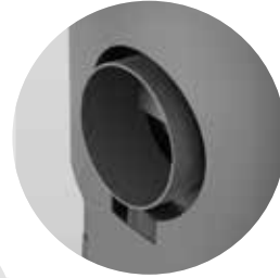
Anschlussstutzen für Verbrennungsluftzufuhr